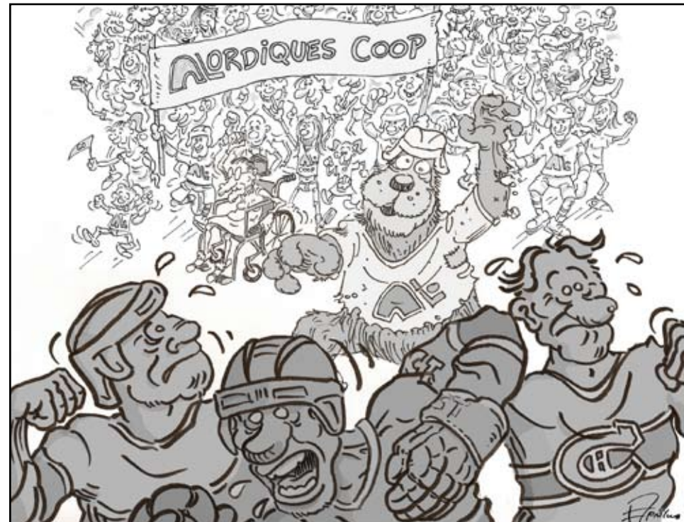
Et si on fondait Les Nordiques sous forme coopérative?