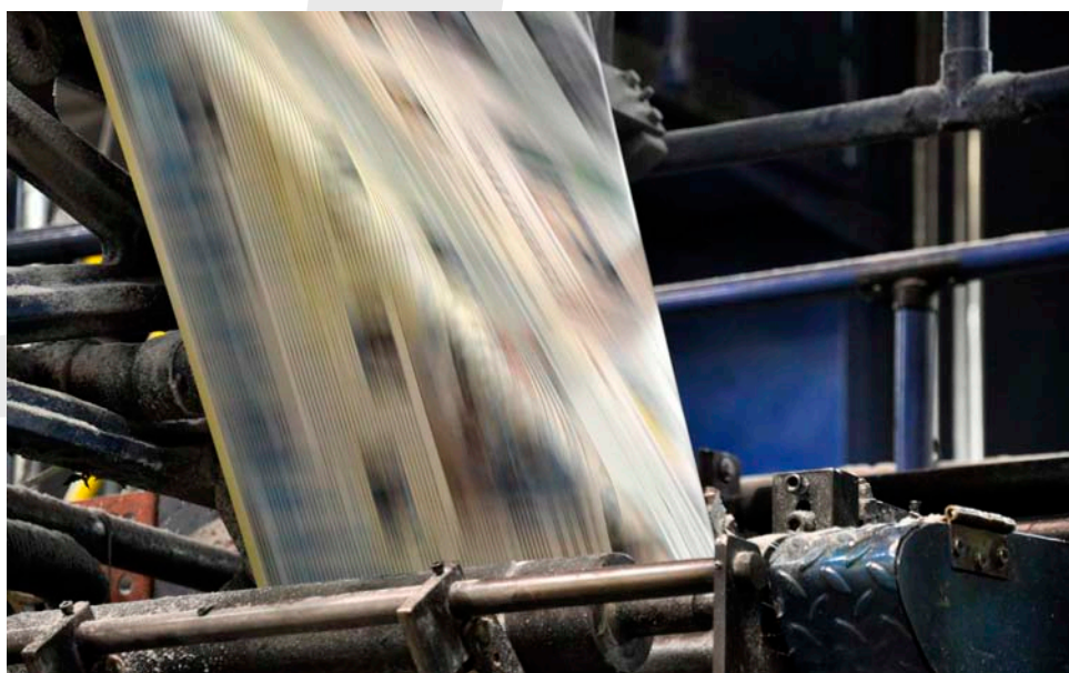
Les Presses du Fleuve impriment plusieurs journaux indépendants et coopératifs.

C'est dans la région de Québec-Appalaches qu'a pris naissance la presse coopérative au Québec. En plus du Journal de la Beauce , du Journal de Lévis , et bien sûr de L'Oie Blanche , fondée à Montmagny en 1990, la région compte le seul imprimeur indépendant à l'est de Montréal, Les Presses